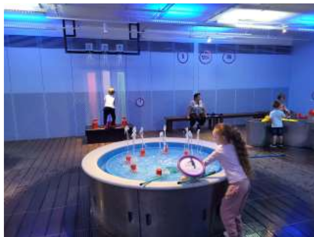
2 photos : visite des enfants à Vulcania