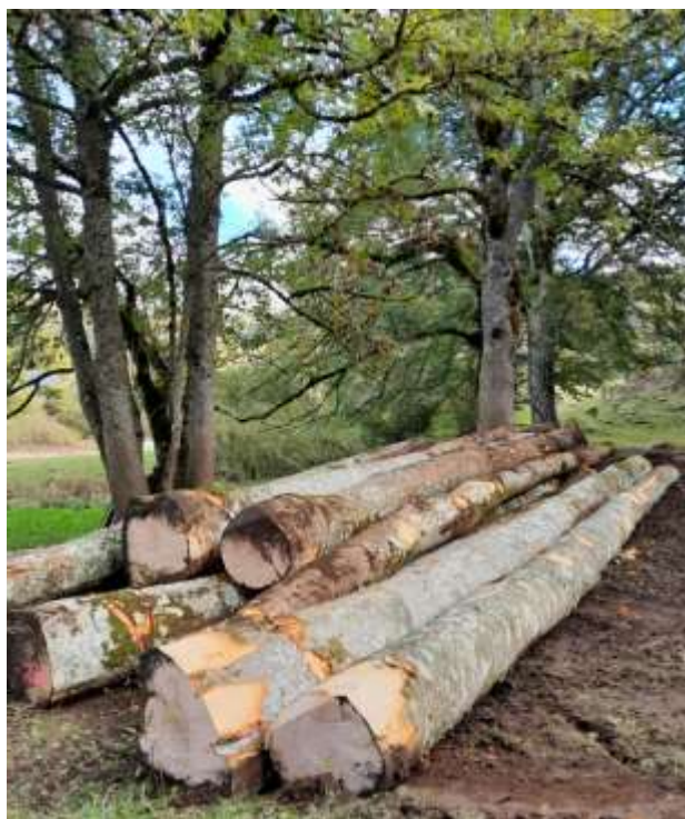
Jolies grumes de Hêtre de Sciage