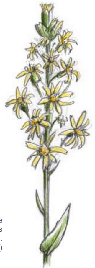
La Ligulaire de Sibérie est une relictte glaciaire qui pousse sur les berges du lac des Bordes (dessin F. Claveau)